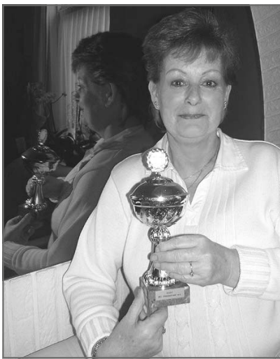
An met de wisselbeker

Deze prijs wordt toegekend door de Bewonersraad HaagWonen, die bestaat uit vertegenwoordigers van de bewonerscommissies. In de bewonerscommissie zitten allemaal vrijwilligers die voor advies, vragen en problemen bij de Bewonersraad HaagWonen terecht kunnen.