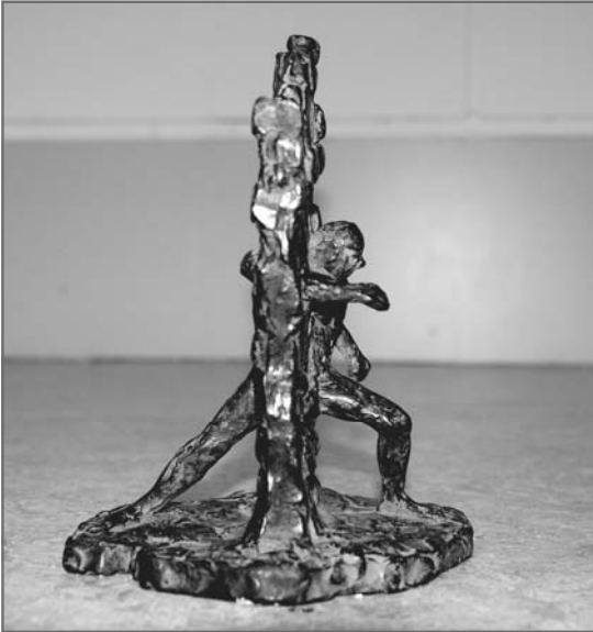
Beeldje "De Doorbraak" van kunstenaar Peter de Leeuwe

De wijk is aan het veranderen. Haar oude Katholieke school is inmiddels het buurthuis 'De Boskant' geworden. De vroegere kapel is